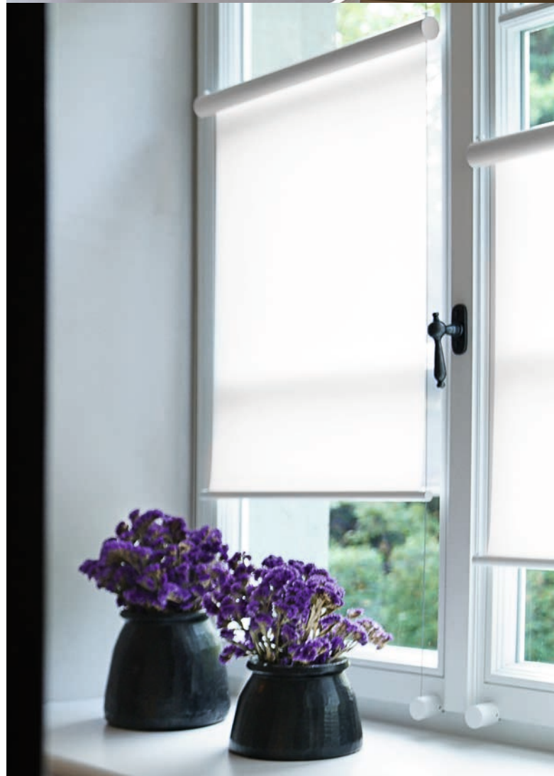
Referenz: Denkmalgeschütztes Herrenhaus